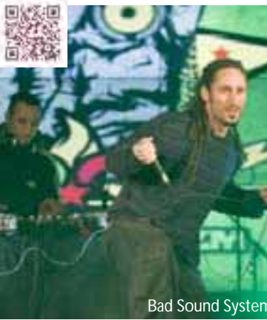
Bad Sound System

Valentzia aldetik datorkigu Jupiter Lion taldea.