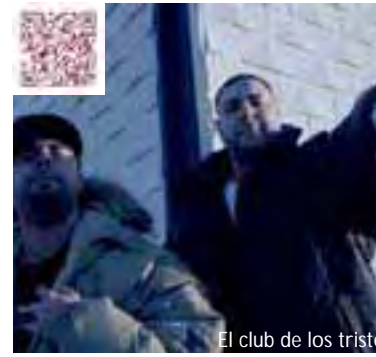
El club de los tristes

Bertan Urretxu-Zumarragako talde hauek arituko dira: THROW RAP , AGRESIÓN VERBAL eta ARTILLERIA PESADA . Baita Irungo KULTO KULTIBO eta Madril-Sevillako EL CLUB DE LOS TRISTES talde eza-guna (Jompy, trafik eta DJ Lazer osatutako taldea). Clubekoek bere azken lana aurkeztuko digute. Animatu eta hurbildu gozatzera!