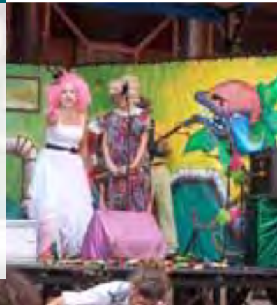
HAUR ETA GAZTETXOENTZAKO ANTZERKIA (*Eguraldi txarra egingo balu, ekintza bertan mantenduko litzateke.)

"TXINTXARRA ETA INURRIA" KONFUSION ANTZERKI TALDEA La Fontainen "Txintxarra eta Inurria"-ren bertsio berri eta alaiago bat aurkezten dizue. Betiko ipuina pixka bat aldatu eta dantza, musika, abestiak, umorea eta Irakaspen bat sartzen dira. Benetako historiaren gakoak ahaztu gabe: 4 urtaroak, lana eta alferkeria. Lan hau batez ere umeentzako egina da baina helduek ere asko gozatzeko dute.