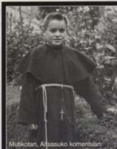
Muttikotan, Altsasuko komentuan.