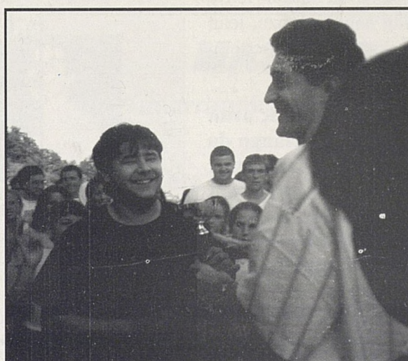
Bai gustora, saskibaloiko txapeldun TXJKJA!

EZ ZARETE ATLANTARAKO SAILKATU, BAINA LASAI, LAU URTE DITUZUE PRESTATEKO