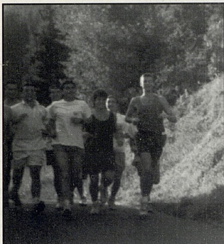
Lehenengo denok batera