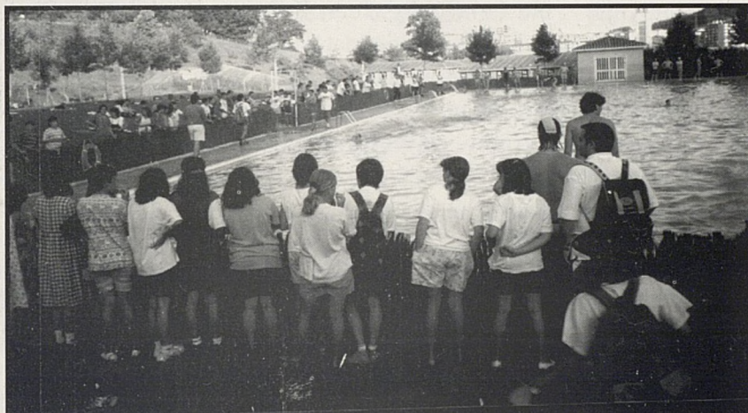
A ze fans pila!