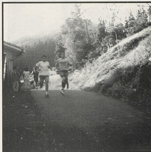
Gero onenak aurrera